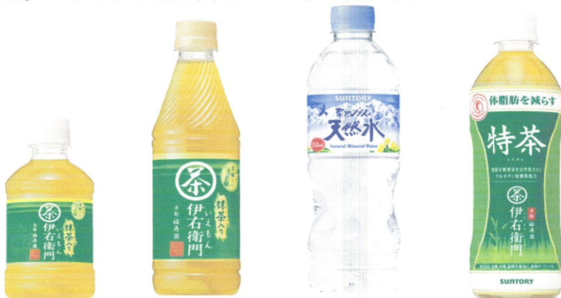
伊右衛門280ml 伊右衛門435ml 天然水550ml 特茶550ml